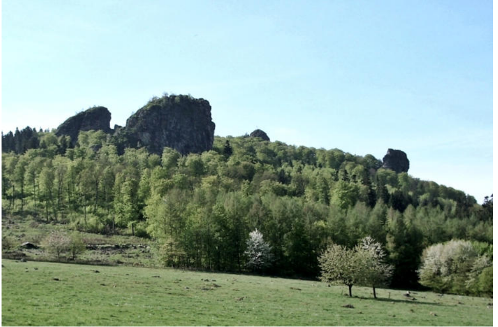
Die »Bruchhauser Steine«, Blickrichtung Süden.