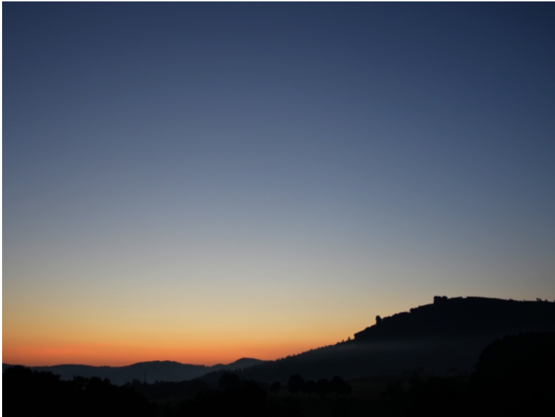
Die »Bruchhauser Steine« in der Morgendämmerung, vor Sonnenaufgang am 21. Juni, Blickrichtung Nordosten.